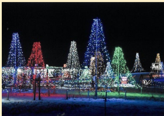
『藤島歴史公園「Hisu花」イルミネーション』

旧年中は皆々様到大変お世話になりました。本年も相変わらずご指導ご鞭撻宜しく願い申し上げます。又日頃からゆきやなぎに対しご支援ご協力を賜り厚くお礼申し上げます。昨年も災害の多い年でしたが、今年は穏やかな年で有ります様願うばかりです。